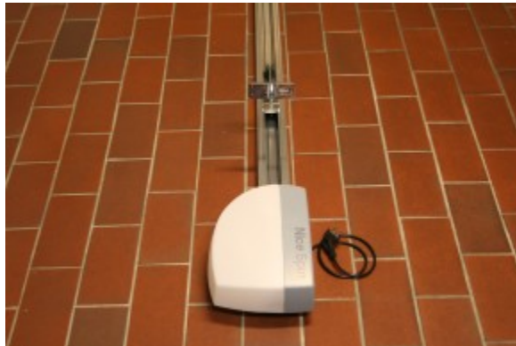
Bildet viser garasjeportåpneren av type "Nice"